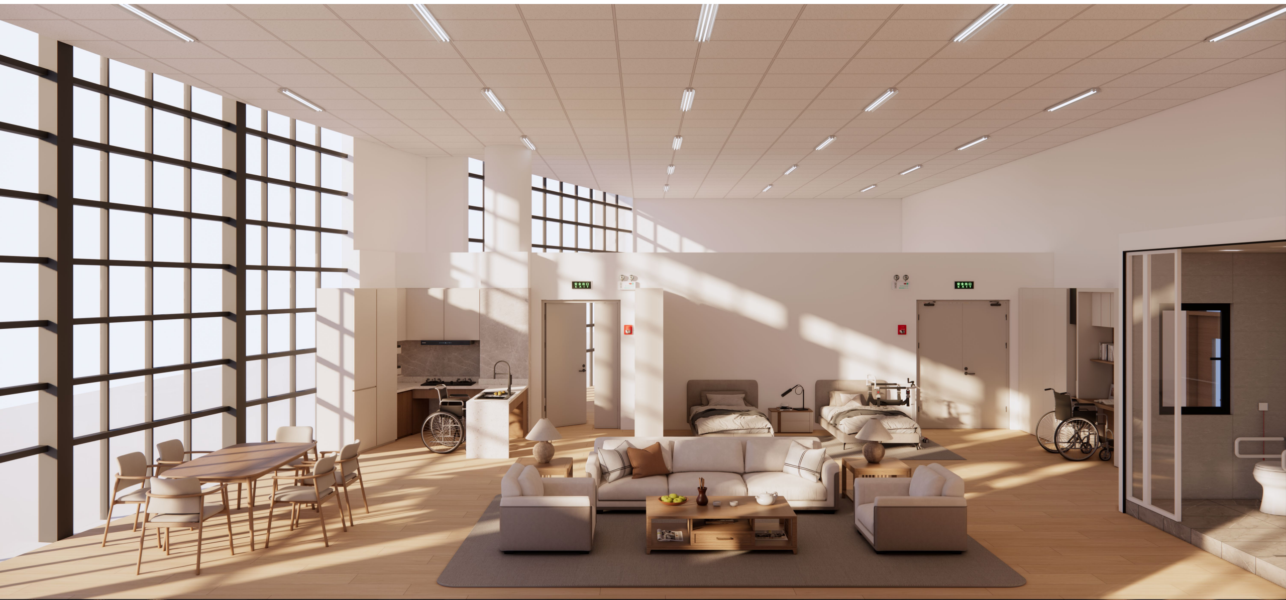
居家养老实训室/智慧照护实训室