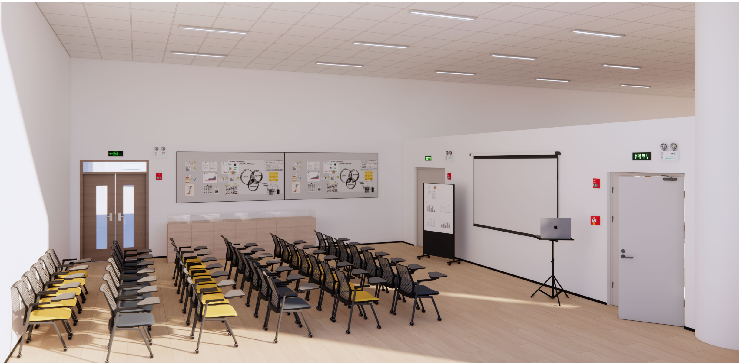
启学探索实训室/适老改造实训室