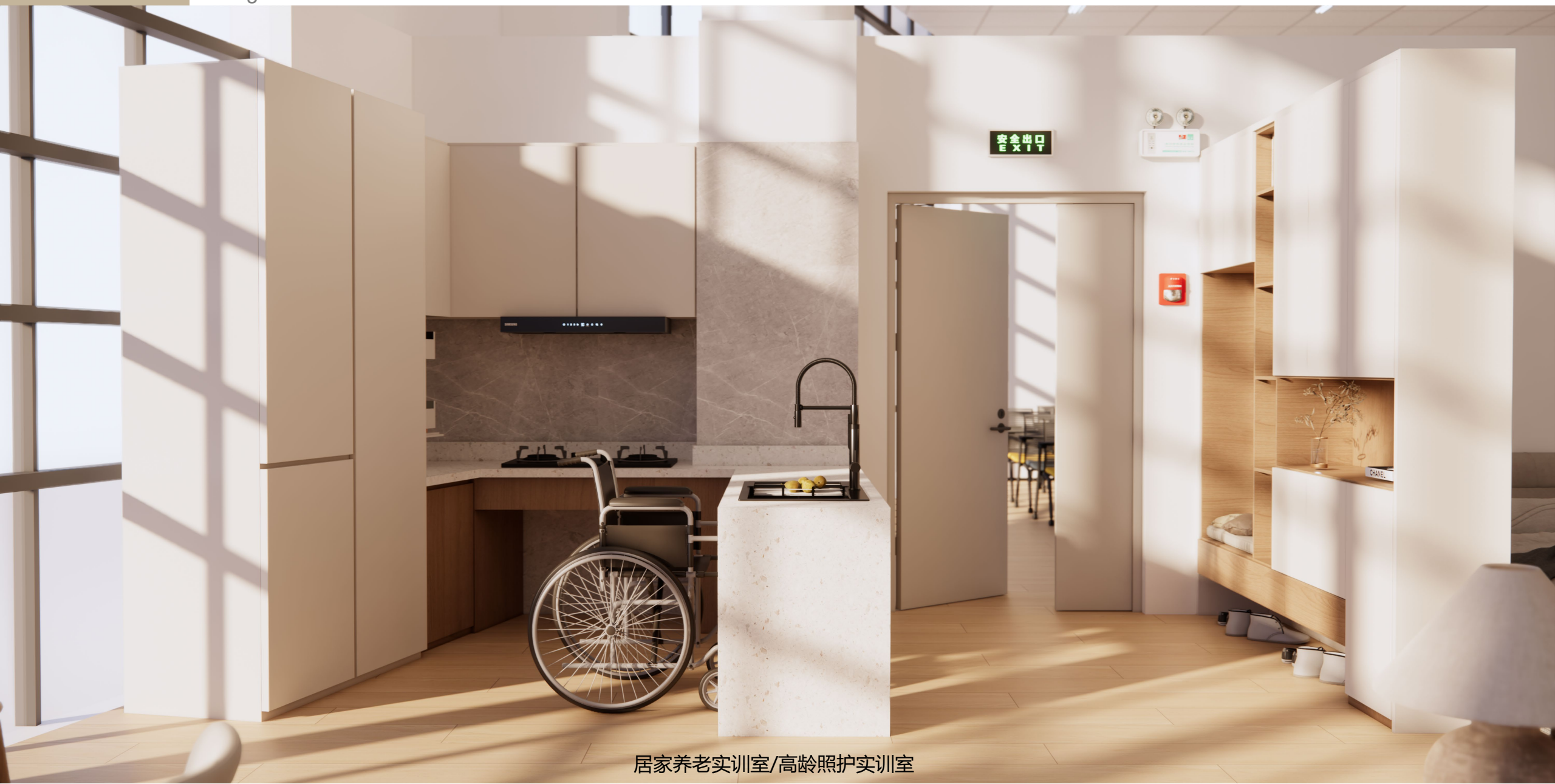
居家养老实训室/高龄照护实训室