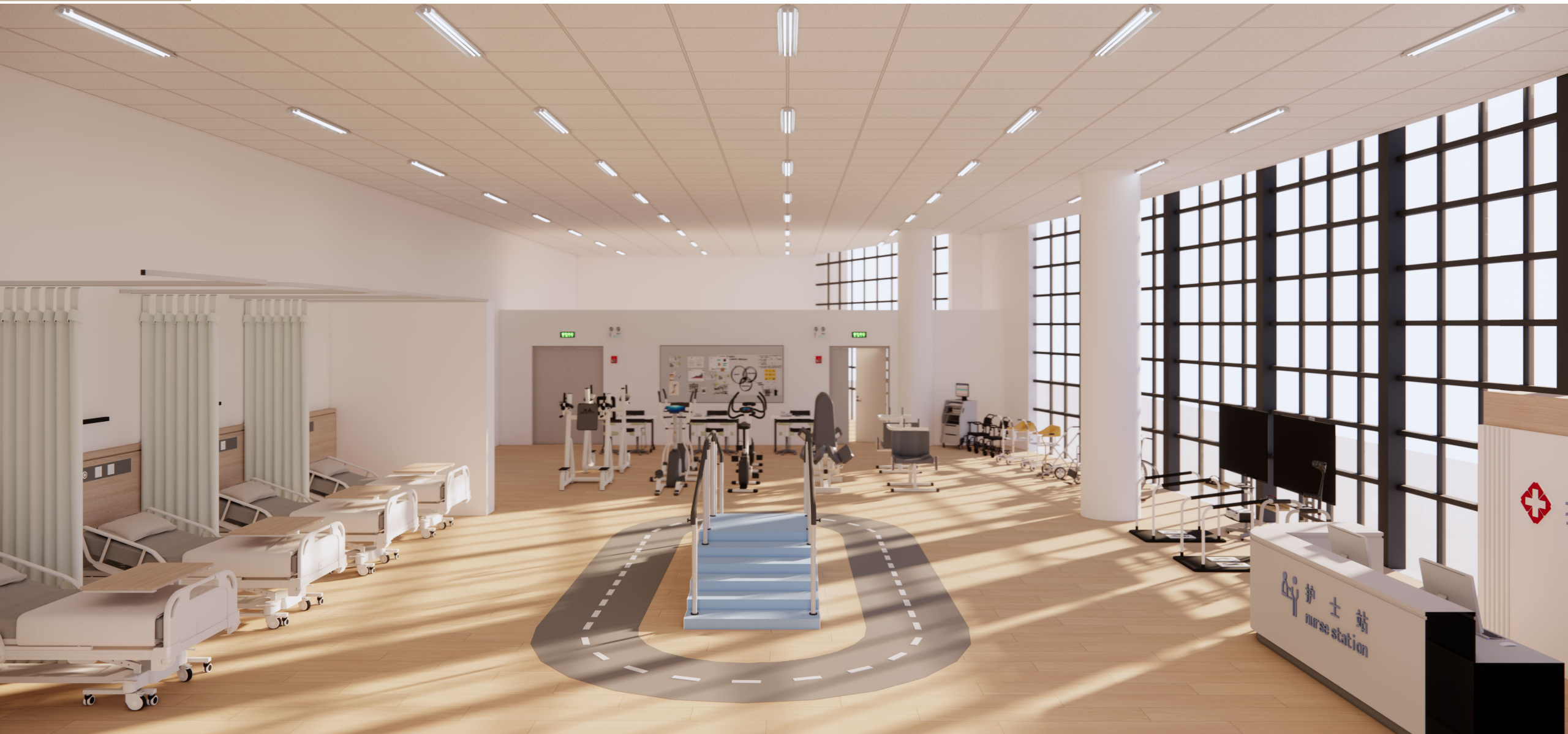
机构养老实训室/高龄照料实训室